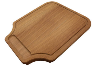
Tabla de corte de madera Iroko 8647 000