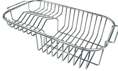
Cesta portaplatos inox 8100 301